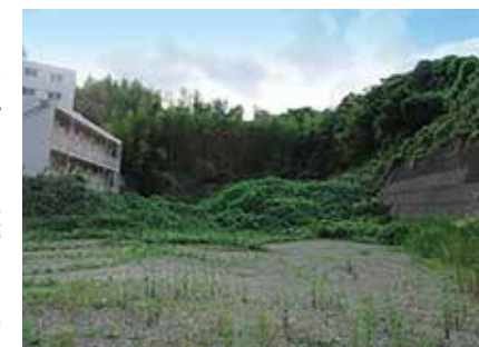
桜木東戸塚線 国道1号 山谷交差点側

当局からは、測量や地下水の調査、最新の知見や高度な技術導入の考えが示されました。