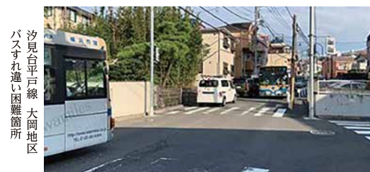
バスすれ違い困難箇所 汐見台平戸線 大岡地区

鎌倉街道と横浜横須賀道路の別所インターチェンジを接続する「汐見台平戸線」は、周辺小学校の通学路にも指定されており、拡幅整備の期待が大きい路線です。平成30年度から国の交付金を活用して改良事業が進んでいますが、未整備区間では、幅員がバス1台程度の場所もあり、地震火災時の延焼遮断帯の効果も期待されて拡幅整備が進められています。