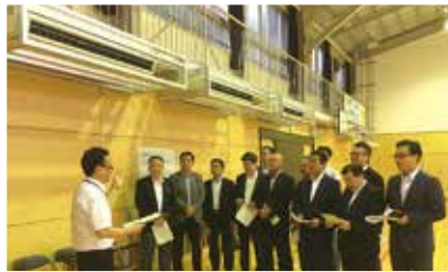
日吉南小学校のエアコンを視察

新年度予算案では、3校の既設体育館への設置予算と20校分の設計予算が計上されています。また、比較的安価で冷房効果が得られるスポットクーラーも10校分が盛り込まれました。