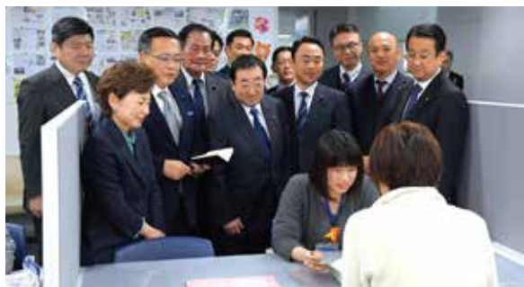
母子保健コーディネーターによる相談支援を視察

その中でも、母子健康手帳交付時の面接・相談や、個々の状況に適した情報提供等を実施し、産前産後の支援の充実を図る母子保健コーディネーターの配置拡充を要望していましたが、令和2年度予算案に新規7区含む全18区への配置を盛り込むことができました。