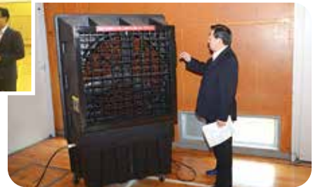
永田台小学校のスポットクーラーを視察