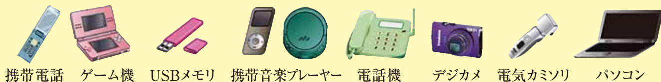
携帯電話 ゲーム機 USBメモリ 携帯音楽プレーヤー 電話機 デジカメ 電気カミソリ パソコン