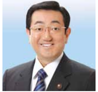
公明党横浜市議員 南区政務調査事務所長 横浜市議員