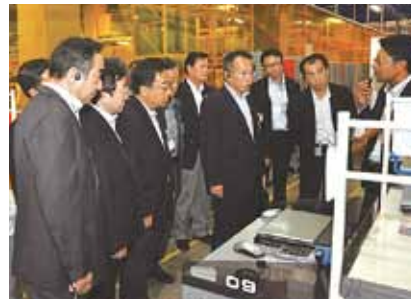
医薬品用物流拠点を視察(8月27日)