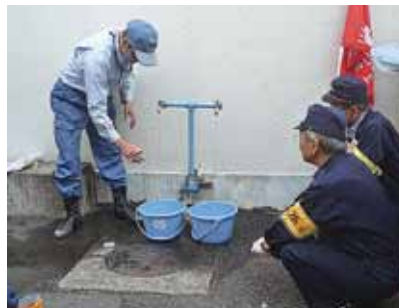
三ツ境小学校での訓練(10月20日)

そのため172カ所の小中学校に設置されている受水槽や屋上の高置槽を活用し、さらに防災訓練に学校受水槽等からの応急給水訓練の実施を盛り込むよう提案しました。今後各区での展開が検討されます。