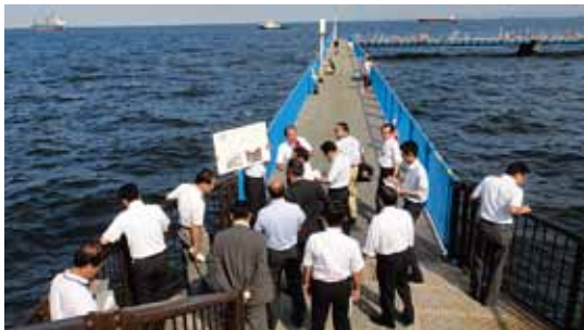
港湾施設を視察(8月9日)

す。公明党横浜市会議員団は、こうした港湾施設における老朽化等の状況を把握するため横浜港を調査し、市内経済の要であり、災害時にも輸送の重要な経路となる港湾施設の耐震化、防災対策及び長寿命化を計画的に進めるよう平成25年度予算要望で市長に申し入れました。