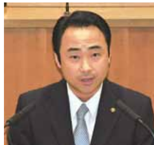
質問に答える齊藤伸一議員