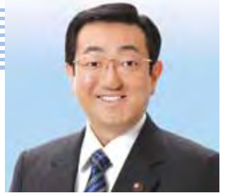
公明党横浜市議員団 南区政務調査事務所長 横浜市議員