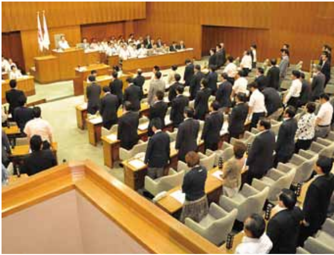
賛成多数で市民協働条例が可決された(6月21日本会議場)

公明党が主導して提案した「横浜市市民協働条例」が公明、自民、民主、みんなの党、共産、ヨコハマ会の全ての会派の賛成によ