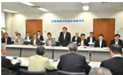
参加団体と活発な意見交換が行われた(6月25日市会会議室)

公明党市会議員団と市民団体や業界団体代表が意見交換する「政策懇談会」を6月下旬に行いました。参加した約30団体から寄せられた様々な提案は、来年度の予算要望に反映するほか、市議団の今後の施策に活かします。