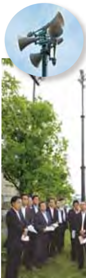
設置状況を視察(6月8日象の鼻パーク)

沿岸6区(鶴見、神奈川、西、中、磯子、金沢)で約100箇所整備されます。『耳の不自由な方や外国人にも配慮したシステムにすぎ』との公明党からの提案により、ライトの点滅や「TSUNAMI」を強調した呼びかけが行われます。