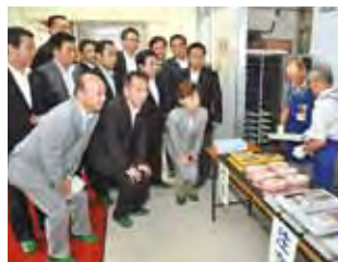
(7月2日 鶴見区・矢向中学校)

公明党市会議員団は従来から「横浜方式のスクールランチ」を提案しており、本年2月の市会本会議では「これまでの調査を踏まえ、早期に具体的な取り組みを行うべき」と主張しました。横浜市教育委員会はこれを受け、6月下旬から3週間にわたり市立中学校における昼食のあり方検討のモデル実施協力校でデリバリー方式の昼食提供を行うこととしました。