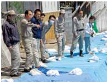
仙台市内での造成地被害視察

名取市・仙台市の被災状況を調査しました。特に、大地震による沿岸部の津波被害や内陸部造成地の液状化被害と高層マンション被害に注目し状況を把握に努めました。