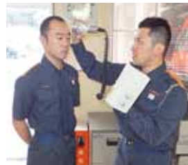
表面汚染を測定するGMサーベイメーター(放射線測定器)