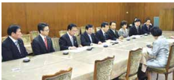
平成23年度予算要望を林文子市長に行う 公明党市議団代表(H22.10.28)

美しい横浜港 公明党は、横浜港を世界5大美港に続く世界に冠たる美しい港に、と主張してきました。23年度予算では、市民との協働により海域浄化の具体的取組を推進します。