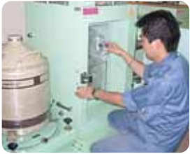
核種分析測定装置

補正予算で増設を予定している測定機器による大気放射線量や、水道水、野菜等の放射性物質の検査データの公表について、正確なデータを市民に分かりやすく迅速に公表するように要請。