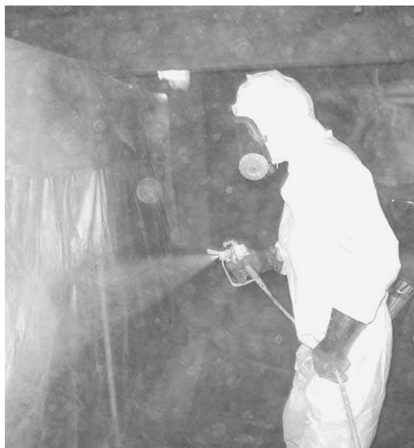
建設業労働災害防止協会の「建築物の解体等工事における石綿粉じんへのばく露防止マニュアル」より引用

横浜市では、アスベスト(石綿)問題について総合的な対策を行うため「アスベスト対策会議」を設置しました。 市立学校や市民利用施設における吹き付けアスベストについては、昭和62年と63年に調査し、除去などを行いました。現在はアスベストを一部含む吹き付け材について調査し、必要な対策を講じています。 相談や問い合わせは横浜市コールセンター TEL(664)25255 FAX(664)28282 お問い合わせ下さい。