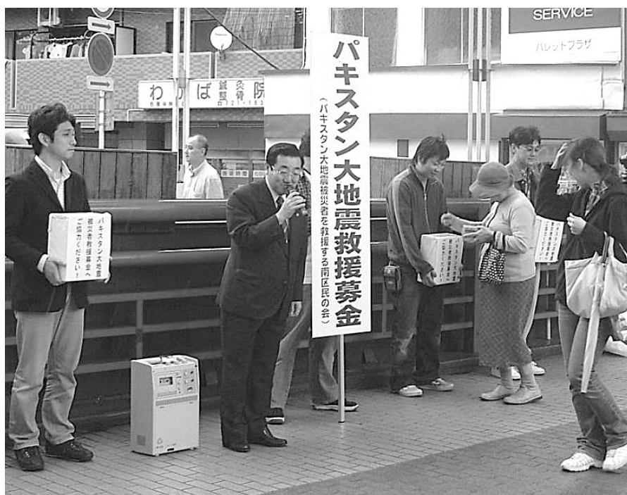
パキスタン地震の被災者救援募金の協力を呼び掛ける仁田市議(手前左から2人目):弘明寺商店街

市内の日本赤十字社告しています。 同会は後日、横浜 の第二の巨大な死 と寒さや飢えなどに に支援を増強しない うとしていて。直ち ヤ山脈の冬を迎えよ 長は「過酷なヒマラ アナン国連事務総