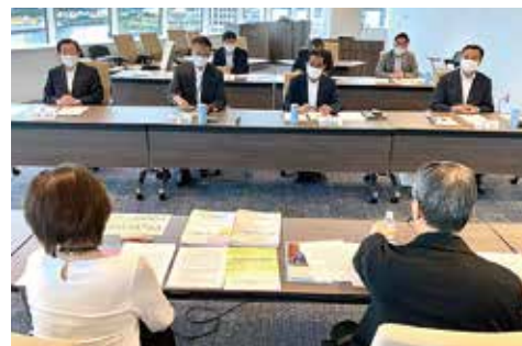
「アレルギーを考える母の会」と懇談