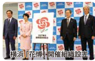
横浜「花博」開催組織設立