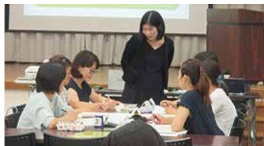
保育所の園内研修リーダーを育成するグループワーク

副市長からは、保育や幼児教育の研究、施策立案と推進、相談、現場の支援、研修による人材育成、情報発信など、一体的に実施していける体制を今後検討していくとの考えが示されました。