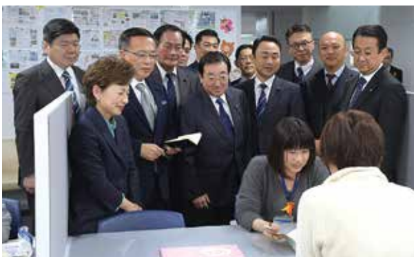
母子保健コーディネーターによる相談支援を視察

厚生労働省は、子どもとその家庭の相談から支援までを途切れなく総合的に担う「子ども家庭総合支援拠点」の必要性を示しています。横浜市でもこの機能を設置すべきと主張しました。