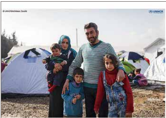
Greece. Thousands of refugees mainly from Iraq and Syria are stranded at the village of Idomeni near the Greek - FYR of Macedonia border ギリシャ、マケドニア国境。ギリシャのイドメニ村では、中東イラクとシリアの難民が数千人も滞留した。