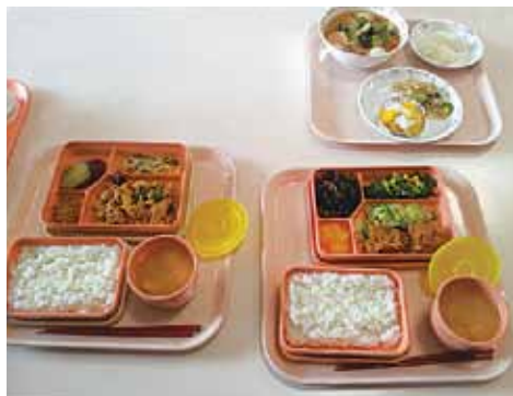
ランチボックスの例

さらに、この結果を踏まえ、出来るだけ早い時期に横浜らしい中学校昼食のあり方をまとめたいと答弁しました。