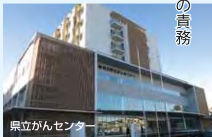
県立がんセンター