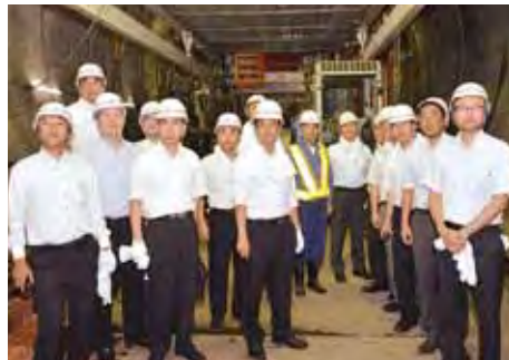
現場で進捗状況の確認

この事業について、公明党は早くから相鉄線沿線住民の利便性などを考え、早期実現を目指してきました。今後も国、県、市の連携を軸に、沿線地域の活性化や新駅周辺の快適で住みよい街づくりにも力を注いで参ります。 横浜市内で進められている「相鉄・JR直通線」事業の建設現場を公明党県議とともに訪問し、新設される羽沢駅(仮称)や、連絡線のトンネル掘削工事現場を視察しました。この事業は、相鉄線西谷駅(保土ヶ谷区)とJR東海道貨物線横浜羽沢駅(神奈川区)までの区間(延長約3キロ)に連絡線を建設し直通運転するもので、完成は平成30年度の見通しです。