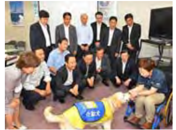
介助犬によるサポートの様子