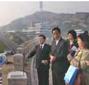
▲左写真奥にある山の頂上より港のコンテナを臨む